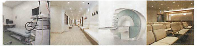
内視鏡センター レディースフロア 画像診断センター 再検査・精密検査 専門外来フロア

東京SR経営労務センターでは、春日クリニックとの提携により、人間ドックを一般価格よりお安くご利用いただけます。