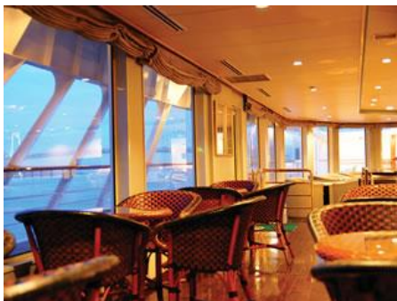
シンフォニーモルデナ号の船内